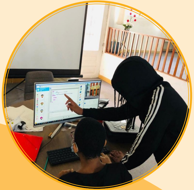
Formation au codage, CAYSTI CHAMPION CAMP