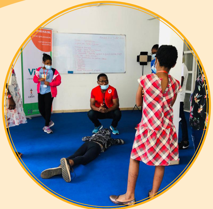
Atelier de secourisme coordonné par la Croix-Rouge du Cameroun