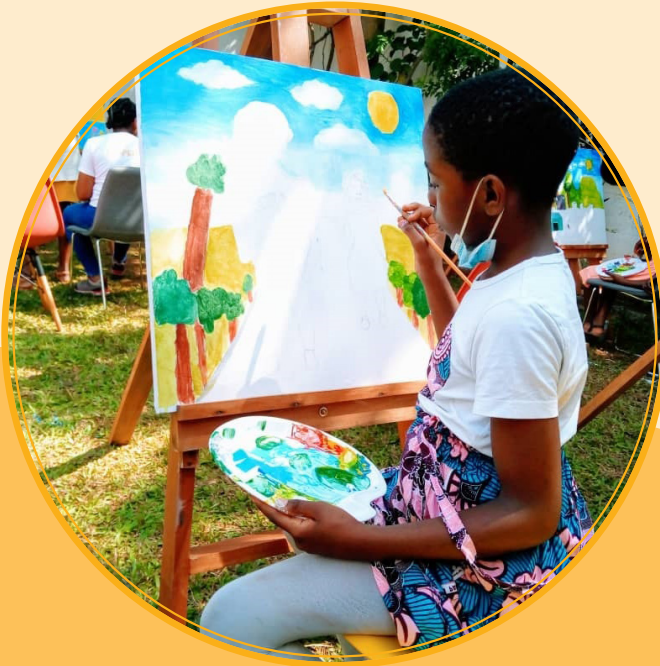
Atelier de peinture, CAYSTI CHAMPION CAMP